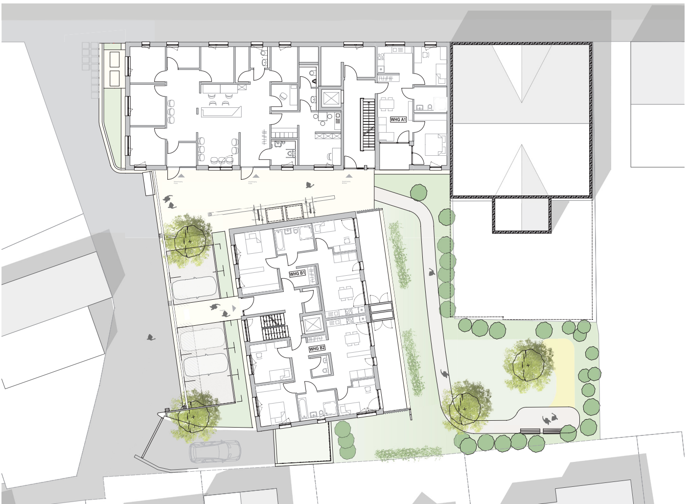
Grundriss Erdgeschoss mit Freiflächen, Haus A + B

Hinweis: Alle Illustrationen und Grundrisse sind unverbindlich. Sie können nicht enthaltene Möblierungen und Ausstattungsgegenstände zeigen. Irrtümer und Änderungen sind vorbehalten. Die Ausstattung erfolgt gemäß Baubeschreibung.