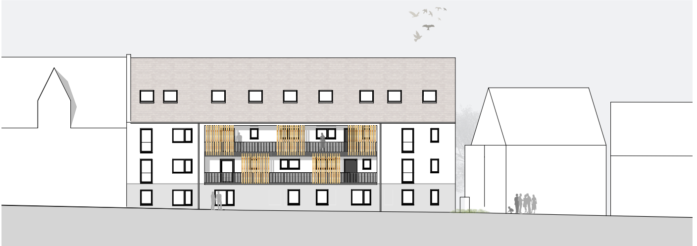
Ansicht Nord, Haus A / Brühlstraße 10