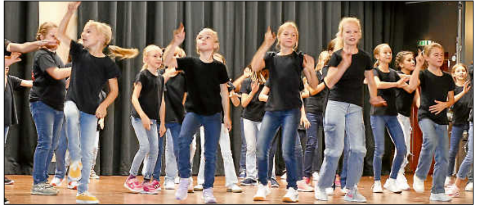
Mit Freude und vollem Einsatz dabei: Die Jazztanz-Minis und Kids gaben auf der Bühne alles.