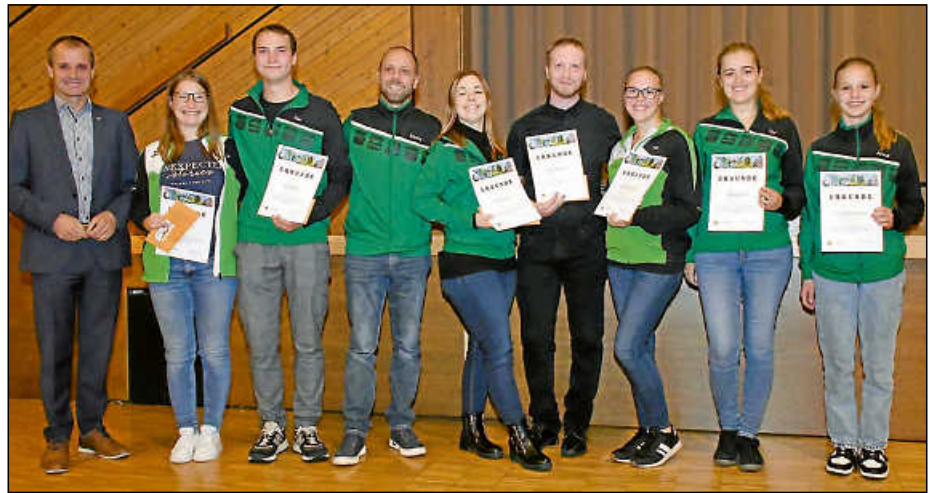
„No X-cuses“ der Rocking Stars erzielten einen 7. Platz bei den Deutschen Meisterschaften.

Auch beim Boule spielt Plochingen eine Klasse höher: Dem Team 1 des Le cochonnet-boule club Plochingen gelang