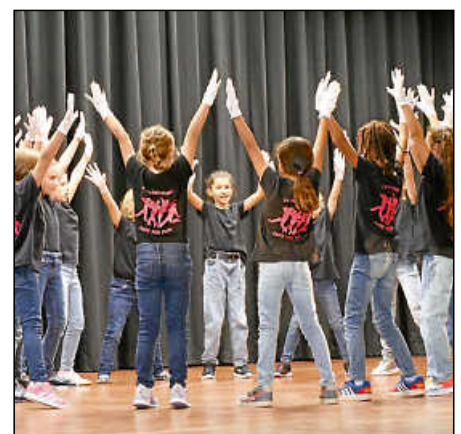
Die Jazztanz-Minis begeisterten das Publikum mit ihrer Aufführung.

Nach dem musikalischen Auftakt und der Verleihung der Ehrungen gab es zum