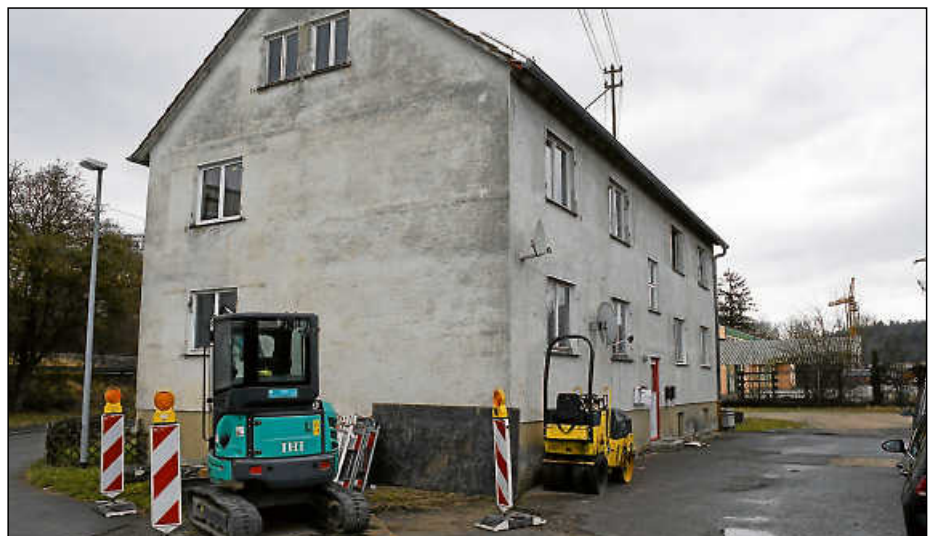
Das Wohnhaus Filsweg 9 diente zuletzt noch als Obdachlosenunterkunft.

Jetzt soll dies im Zusammenhang mit dem Firmengebäude geschehen. Vorab erstellte ein Ingenieurbüro ein Gebäudeschadstoff- und Bausubstanzgutachten, das den insgesamt sechs Firmen, die sich am Ausschreiben beteiligten, zur Verfügung gestellt wurde. Die Stahlhalle werde von einer