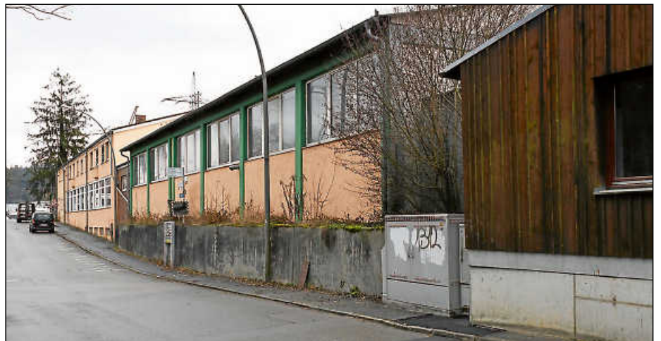
Die Fläche, auf der momentan noch das ehemalige Firmengebäude von Wayss und Freytag (l.) steht, könnte bald zu einer attraktiven Adresse für Gewerbebetriebe werden.

Der Abrissauftrag wurde in insgesamt vier Losen ausgeschrieben: Das zweigeschossige Mehrfamilienhaus Filsweg 9, das ehemalige Werkstatt-Büro und Wohngebäude Filsweg 11, der Abriss einer Stahlhalle sowie der zugehörigen Betonbodenplatte und der Abriss des asphaltierten Hofbereichs vor dem Gebäude Filsweg 11 bildeten je ein Los. Nach dem Leiter des Verbandbauamts Wolfgang Kissling habe man das Wohnhaus Filsweg 9 schon im vergangenen Jahr abreißen wollen, dann kam ein Krankheitsfall dazwischen.