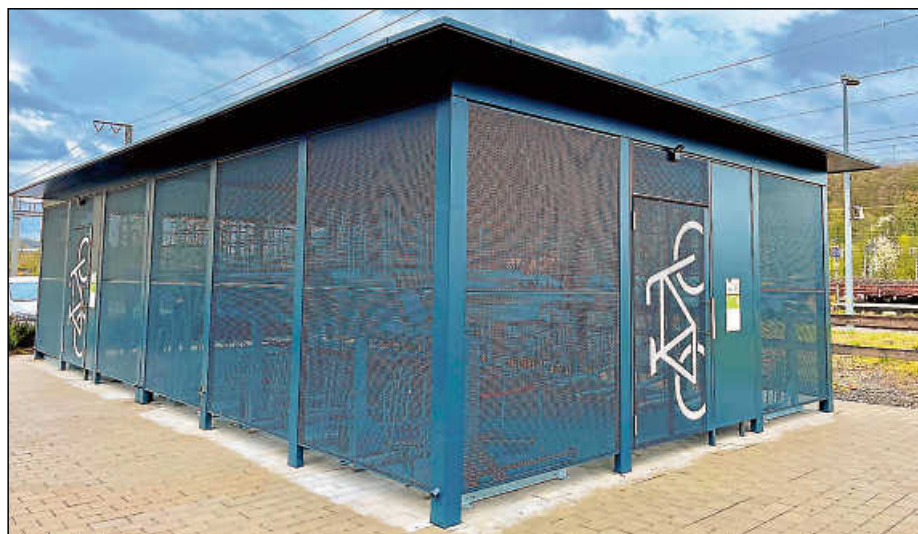
Das „Radhaus“ bietet neben einer sicheren und trockenen Lagerung auch Lademöglichkeiten.

Die Fahrradstation in Plochingen wurde von der Kienzler Stadtmobiliar GmbH hergestellt und durch die Zukunft-Umwelt-Gesellschaft gGmbH (ZUG) aus Bundesmitteln der Nationalen Klimaschutzinitiative des Bundesministeriums für Wirtschaft und Klimaschutz in Höhe von 111 786 Euro bezuschusst. Weitere Fördergelder über 126 540 Euro gewährte das Regierungspräsidium Stuttgart im Rahmen des Förderprogramms kommunale Rad- und Fußverkehrsinfrastruktur (RuF) des Landesgemeindeverkehrsfinanzierungsgesetzes (LGVFG). Die Stadt Plochingen ist dankbar über diese Unterstützung, die eine Realisierung der Plochinger Fahrradstation erst ermöglichte.