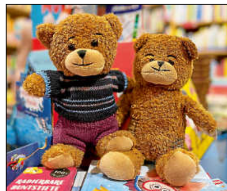
Teddys für die Umgestaltung gibt's im Osiander.

Hilfsbereite Bürgerinnen und Bürger können jetzt in der Plochinger Filiale der Osiander'schen Buchhandlung einen Hoffnungsbären zu sich nach Hau-