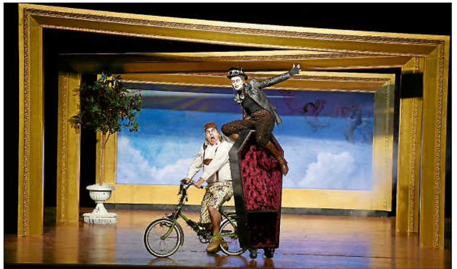
Der Brandner Kaspar mit dem Knochenkarle auf ihrem Weg zur Erde.