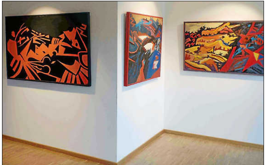
Sammet-Ausstellung in der Galerie der Stadt Plochingen im Jahr 2015.

„Er hat sich gefunden in dieser bizarren Landschaft“, so Röttger. Er liebte die Bewohner, die Berge und Tä-