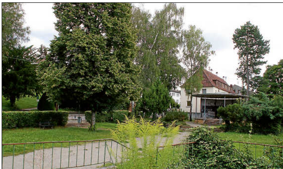
Die Otto-Wurster-Anlage und der darunter befindliche Wasserbehälter sind in die Jahre gekommen und werden einer Wohnanlage weichen.

Als Bauträgerin verpflichtet sich die Kreisbau innerhalb eines Jahres einen vollständigen Bauantrag einzureichen, spätestens zwei Jahre nach Erteilung der Baugenehmigung mit dem Bauen zu beginnen und innerhalb von fünf Jahren das Vorhaben bezugsfertig herzustellen. Zudem muss sie die Stellplätze in der Marquardtstraße einschließlich Begrünung und Baumpflan-