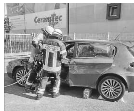
Spreizer im Einsatz

Am Samstag ging es bei bestem Wetter mit der Truppmannausbildung weiter. An drei Stationen wurde unter anderem die technische Hilfeleistung von den Teilnehmern praktisch geübt. An einem Fahrzeug kamen Schere und Spreizer zum Einsatz, an einer anderen Station der Plasmaschneider. Nächste Woche dreht sich alles um das große Thema Brandbekämpfung.