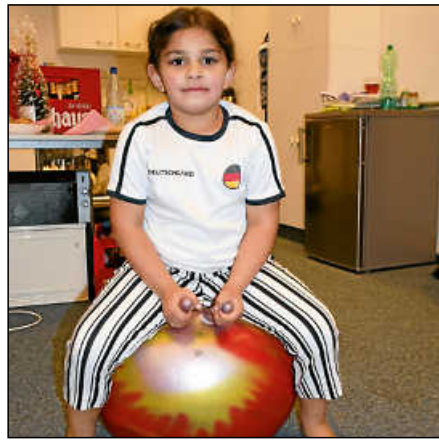
Beim Jubiläumsfest waren auch wieder einige Kinder mit von der Partie und hatten ihren Spaß.