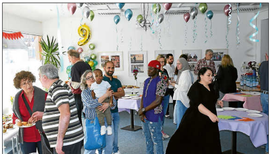
Das Begegnungscafé machte seinem Namen wieder einmal alle Ehre.

in Plochingen eine neue Heimat fanden. Sie helfen in der Kleiderkammer oder der Fahrradwerkstatt mit, unterstützen bei Deutsch-Kursen, geben Nachhilfe für Schülerinnen und Schüler, helfen beim Umgang mit Ämtern, beim Ausfüllen von Formularen, bei der Wohnungs-