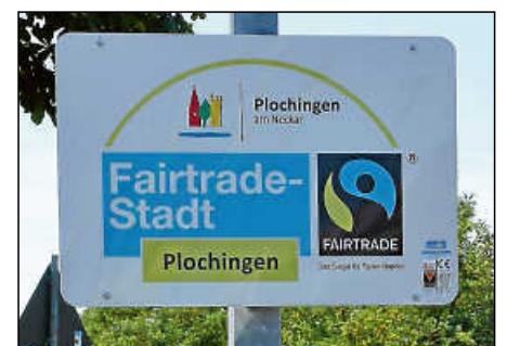
Die Stadt Plochingen darf für weitere zwei Jahre den Titel „Fairtrade-Stadt“ tragen.

Plochingen ist eine von über 820 Fairtrade-Städte in Deutschland. Das globale Netzwerk umfasst über 2000 Fairtrade-Towns in insgesamt 36 Ländern, darunter Großbritannien, Schweden, Brasilien und der Libanon. Weitere Infos unter: www.fairtrade-towns.de