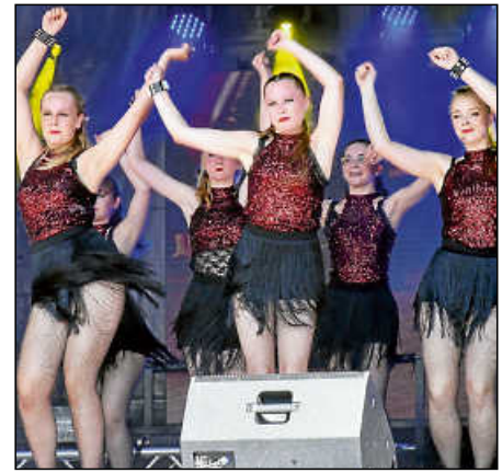
Atemberaubend: Luckaus Tänzerinnen.