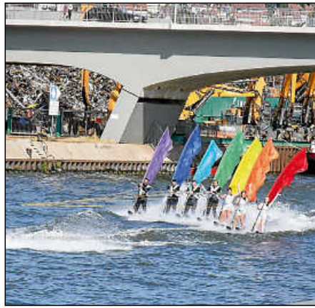
Wasserskivorführungen beim Hafenfest.