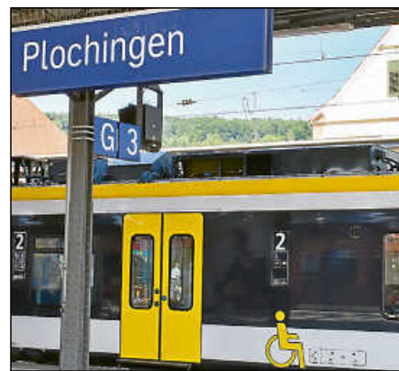
Endlich: Der Bahnhof kann barrierefrei werden.