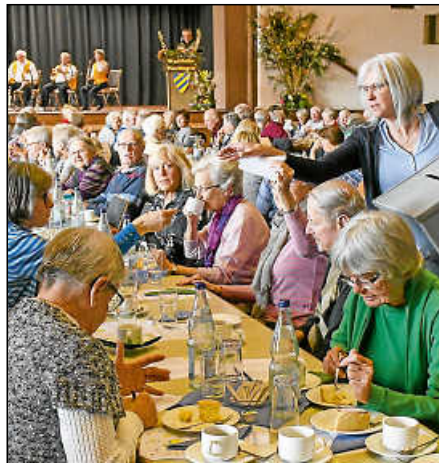
Bei der Wahl des Stadtseniorenrats während des Seniorennachmittags in der Stadthalle.