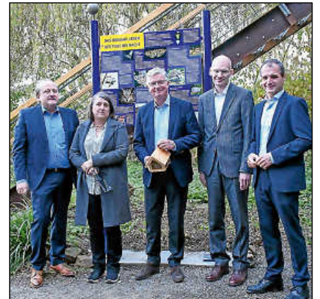
Eine feste Institution auf dem Brückenwasen: Das Umweltzentrum feiert sein 25-Jähriges.