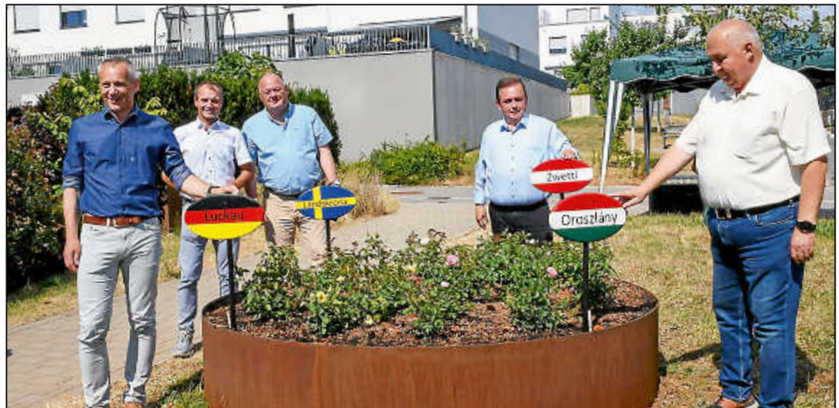
Die Bürgermeister von Plochingens Partnerstädten vor dem neu angelegten Rosenbeet.