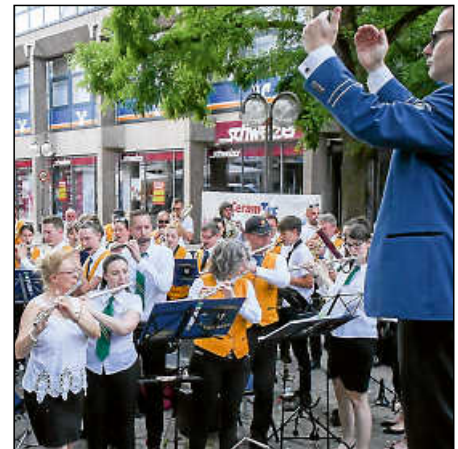
Gemeinsam musizierten die Bergmannskapelle Oroszlány und die Stadtkapelle Plochingen.