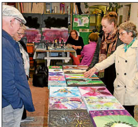
Die Ateliers waren in der Kunstnacht geöffnet.