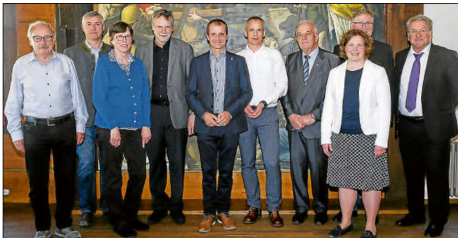
Beim Empfang der Vertreter der Partnerstädte zum Jubiläumsfestakt im Alten Rathaus.