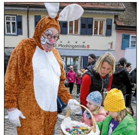
Der Osterhase beim Plochinger Frühling.

Die beiden Tatverdächtigen flüchteten. Am Morgen des 2. Aprils fielen erneut Schüsse, dieses Mal auf die neu eröffnete Shisha-Bar „Medellin“. Dabei wurde der Wirt leicht verletzt. Daraufhin verhaftete die Polizei zwei Verdächtige. Seither nahm sie mehrere Personen fest. Nach dem Anschlag mit einer Handgranate bei einer Beerdigung auf dem Altbacher Friedhof ermittelt die