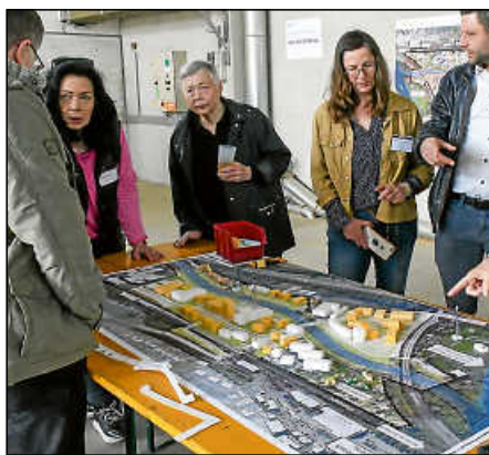
Beim Anliegerdialog im Filsgebiet-West.