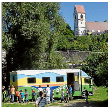
Eines von vier Ökomobilen, die Wald, Wiesen, Gewässer und den Biber den Kindern nahebrachten.