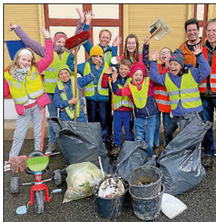
Mit Begeisterung bei der Gemarkungsputzete.