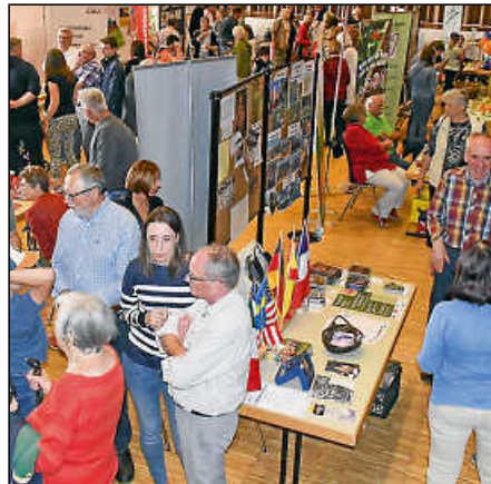
Durchweg positiv war das Feedback zur gut besuchten 1. Plochinger Vereinsmesse.