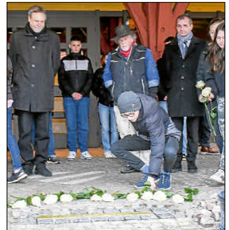
Zum Gedenken an die Zwangsarbeiter legen Schüler an der Stolperschwelle weiße Rosen nieder.