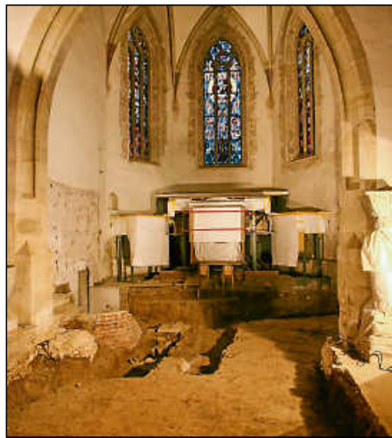
Am Palmsonntag soll die bis dahin sanierte Stadtkirche eingeweiht werden.

Bereits Ende Februar erschütterte Plochingen eine Schießerei in der Marktstraße, bei der ein Wirt verletzt wurde.