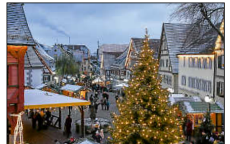
Der Weihnachtsbaum vor malerischer Kulisse.