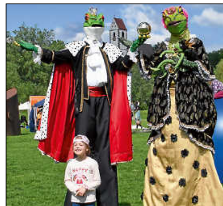
Auf der Spielwiese beim Bruckenwasenfest.

generation vorgestellt und beim gut besuchten Bruckenwasenfest zogen wieder die Stelzenläufer über Plochingens