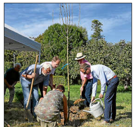
Der OGV pflanzte zu seinem 100-jährigen Jubiläum ein Apfelbäumchen.