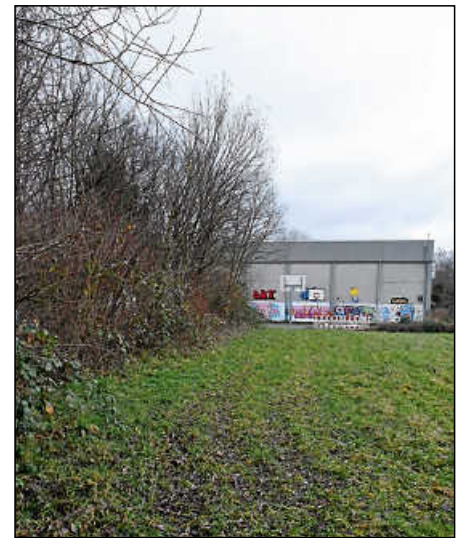
Ein Betriebskonzept für ein neues Bad mit dem SSVE, das gegenüber der Schafhausäckerhalle entstehen könnte, gilt es noch zu erarbeiten.

„Sehr erfreut“ über die Entwicklungen zeigte sich Reiner Nußbaum (CDU). Er