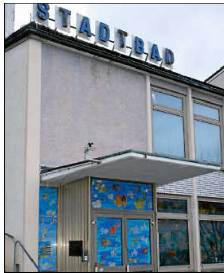
Das alte Stadtbad am Burgplatz wurde bis zur Schließung von Schulen, Vereinen und der Öffentlichkeit genutzt.

Nach Carola Orszulik vom Vorstand des SSVE hat der Verein zwar bei der Eisbahn in Esslingen ein eigenes Freibad mit Sportbecken, das im Sommer auch gute Möglichkeiten zum Trainieren bietet. „Absolut an die Grenzen“ käme man aber im Winter, wenn zwölf Teams trainieren und zugleich Kinderschwimmkurse angeboten werden. Solange das Merkel'sche Bad saniert wird, trainiert der Verein derzeit in sechs verschiedenen Bädern von Vaihingen über Leinfelden bis Stuttgart verteilt.