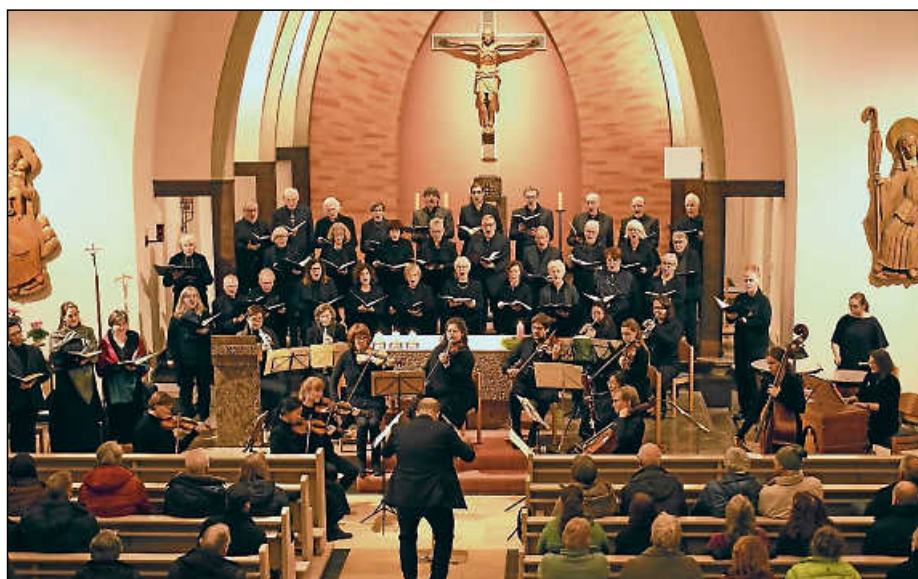
Mit dem Weihnachtsteil des Messias-Oratoriums zeigte die Kantorei ihre ganze Klasse.

In der Mitte steht Händels farbige Vertonung der Ereignisse von Bethlehem.