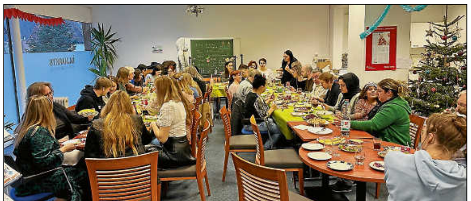
Festlich und friedvoll war es bei der Weihnachtsfeier im Begegnungscafé im Markt 8.

Das Begegnungscafé war weihnachtlich dekoriert, die Tische zu großen Tafeln zusammengestellt und es herrschte eine festliche Stimmung. Die Gäste saßen beieinander, tauschten sich aus und verbrachten gemeinsam eine schöne Zeit. „Vor allem die Familien aus der Ukraine hatten ein paar Stunden, um zu entspannen, zur Ruhe zu kommen, sich zu finden, und sie mussten nicht die ganze Zeit an den Krieg denken“, erzählt Geert Rüger vom LBF.