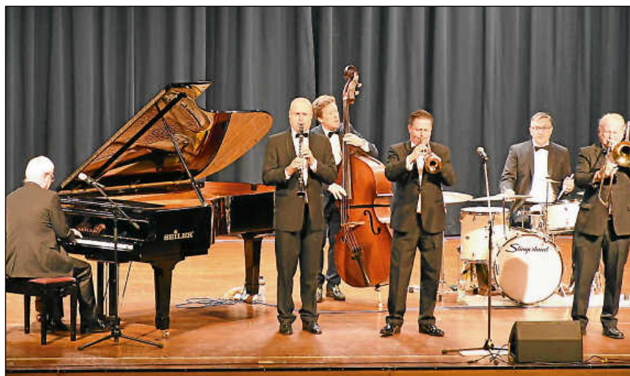
Die Armstrong’s Ambassadors haben den Jazz im Blut. Im Jahr 2018 spielten sie in der Plochinger Stadthalle zum ersten Mal zusammen. Nun kehrten sie wieder hierher zurück.