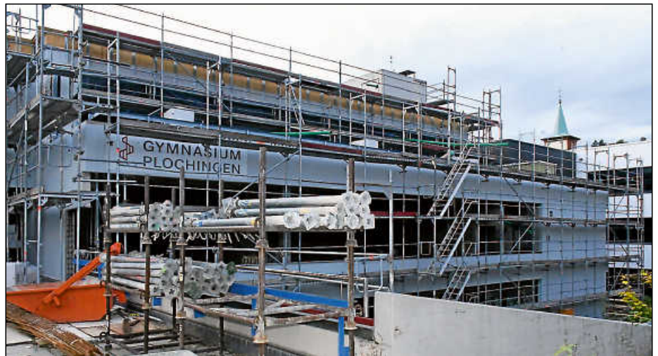
Am Hauptbau des Gymnasiums schreiten die Sanierungsarbeiten voran.

Die OGL-Fraktion schlug eine weitere Variante vor, bei der die Turnhalle zunächst nicht saniert werden sollte. Die Gesamtkosten würden sich damit erst einmal um rund 7,5 Mio. Euro reduzieren. Kissling betonte, dass hierbei die Planungskosten jedoch verloren gehen würden und außerdem für den Gesamtkomplex gebäudetechnisch bedeutsame Arbeiten nicht erfolgen könnten.