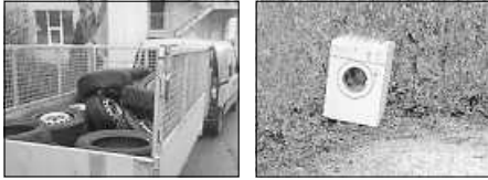
Illegaler Müll

ne. Der Bauhof Plochingen beseitigt diesen Müll mit zuverlässig. Doch eine saubere Stadt ist nicht nur eine Aufgabe des Bauhofs, sondern geht uns alle an. Müll gehört fachgerecht entsorgt und nicht auf den Boden geworfen!