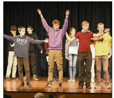
„Ich bin der Weinstock – ihr seid die Reben“, pantomimisch dargestellt von den Konfirmanden.