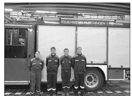
Die frisch gewählten Amtsträger/innen

Nach der Entlastung des Kassenwartes ging es direkt mit den Wahlen zum Jugendgruppenführer/in, stellvertretenden Jugendgruppenführer/in, Schriftführer/in und Kassenwart/in weiter. Da keine Anträge eingegangen waren, wurde die Versammlung beendet und es gab für alle etwas zu Essen und zu trinken.