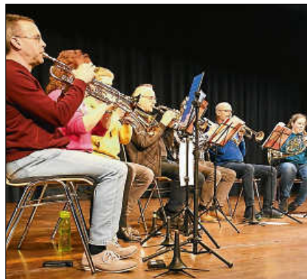
Das Ensemble des Posaunenchores stimmte die Gäste ein.