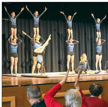
Die Leistungsturnerinnen des TVP begeisterten mit ihren Vorführungen.