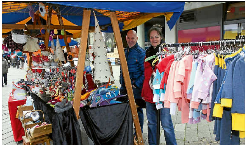
An den Ständen des Ostermarkts wird es auch dieses Jahr wieder viel Selbstgemachtes geben.

Neben dem Karussell und dem Schauschmieden, das die Kinder bestaunen können, verteilt der Osterhase kleine Leckereien. Ferner können sich die kleinen Gäste am Fischbrunnen in einem kleinen Spieleparadies mit Ball-