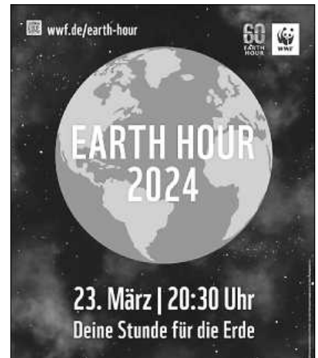
Plakat: WWF Earth Hour

Am Samstag, den 23. März 2024, um 20.30 Uhr, schalten Menschen, Städte und Unternehmen auf der ganzen Welt für 60 Minuten das Licht aus, sparen Strom und setzen damit ein Signal, wie wichtig Klimaschutz ist. Lasst uns zur Earth Hour am 23. März um 20.30 Uhr gemeinsam mit dem WWF Deutschland ein Zeichen setzen. Weitere Infos zur Earth Hour, der weltweit größten Aktion für Klima- und Umweltschutz, gibt es auf: www.wwf.de/earth-hour