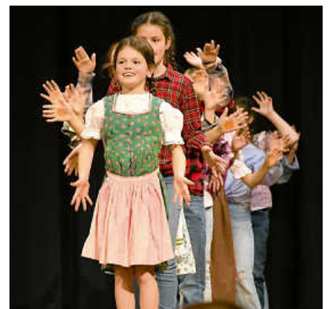
Die Jazz Kids des TVP sorgten für beste Stimmung. Bei „Hulapalu“ gingen alle mit.

men. Das Mietverhältnis wird dann bis zu zwei Jahre lang begleitet. Näheres zum Projekt „Türöffner“ gibt es auf der folgenden Seite zu lesen.