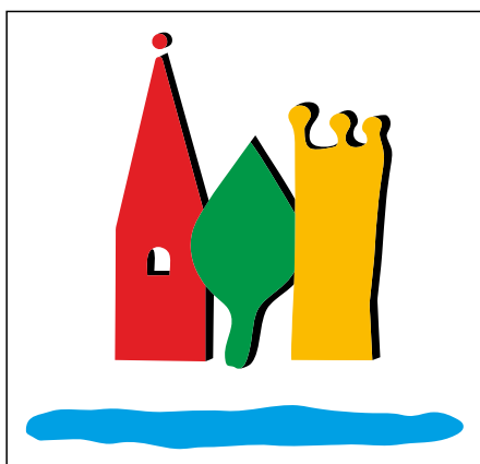
Das Logo der Stadt Plochingen zieren Ottlienkappelle, Landschaftspark, der Regenturm der Hundertwasseranlage und der Neckar.

Seit diesem Monat kann man für Goldtaler in der PlochingenInfo EinzelTagesTickets erhalten.