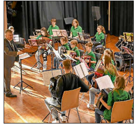
Die Crazy Akkordeon Kids, das Jugendorchester der Harmonikafreunde, bei seinem Auftritt.