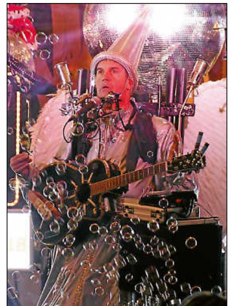
In seiner Show bezog der Eventkünstler auf lustig-charmante Art das Publikum mit ein.