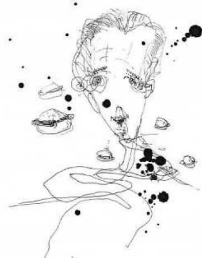
Grafik: Peter Engel

Weitere Informationen finden Sie unter: www.plochingen.de/Theater