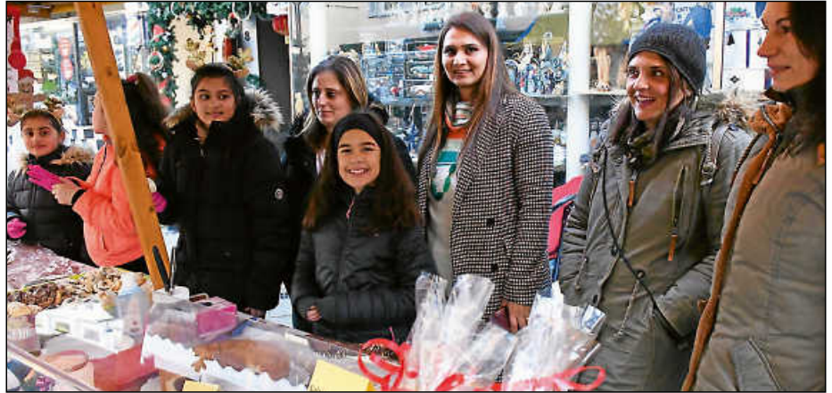
Die Klasse 4a der Burgschule sowie deren Förderverein verkauften leckeren Kuchen.