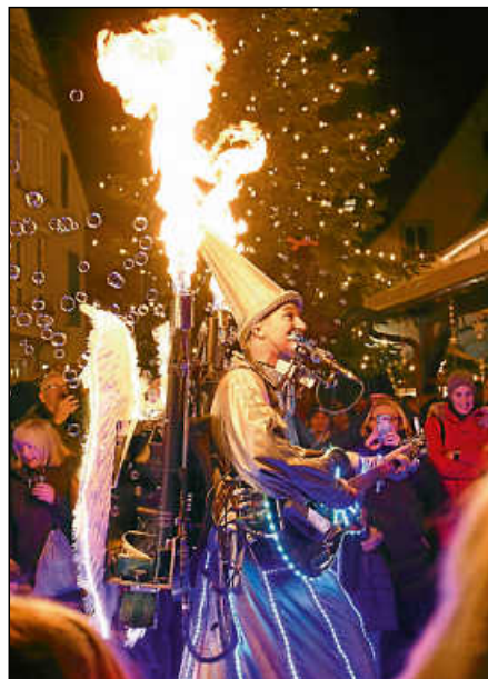
Dr. Musikus ließ es knallen und krachen – die Musikshow begeisterte nicht nur die Kinder.

Bereits der Auftakt mit Dr. Musikus und seiner zauberhaften Musikshow begeisterte Kinder ebenso wie Erwachsene. Der Unterhaltungskünstler und schwebende Weihnachtsengel sang Weihnachtslieder, spielte Gitarre sowie verschiedene Mundharmonikas und war auch noch bis hinter die Ohren elektronisch verkabelt. Er bot eine Lichtshow, brannte auf den Rücken geschallte Fackeln ab, schmiss die Seifenblasenmaschine an, ließ es aus der Schneekanone schneien und zündete ein Feuerwerk. Er präsentierte „Heidschi Bumbeidschi“ und andere Weihnachtslieder in ungewöhnlicher Form, wusste sein Publikum mitzureißen und es zum Lachen zu bringen. Schnell bildete sich ein Kreis von Kindern um den Engel mit seinen Flügeln, die ihren Spaß