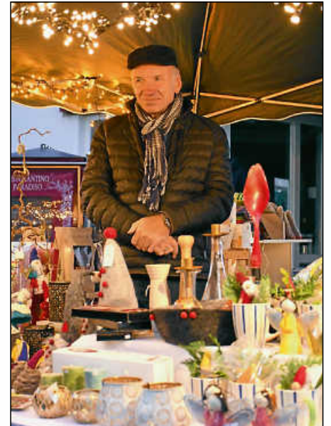
Am Stand des Weltladens konnten fair gehandelte Waren erworben werden.