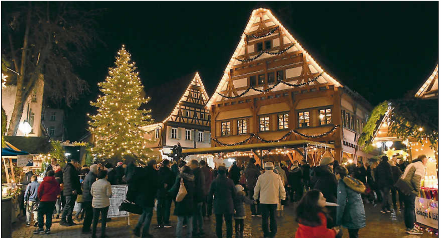
Die besondere Kulisse mit Lichtern am Weihnachtsbaum und auf dem Marktplatz verleihen dem Weihnachtsmarkt eine einzigartige Atmosphäre.

Nach zwei Jahren Corona-Zwangspause fand der Weihnachtsmarkt in Plochingen mit über 50 Ständen wieder statt