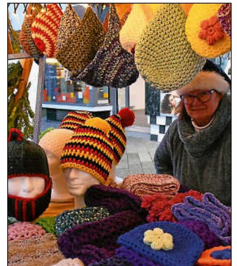
Mit gehäkelten Mützen und Schals kann die kalte Jahreszeit kommen.

die kulinarische Palette. Aber auch entlang der Marktstraße konnte ge-