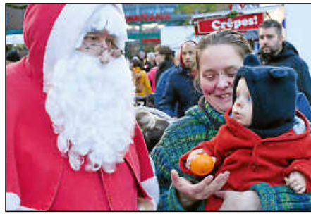
Der Nikolaus sorgte für große Kinderaugen.

Und was den Plochinger Markt neben der schönen Stimmung, den vielen Lichtern und der musikalischen Unterhaltung so einzigartig und besonders macht, drückte vielleicht auch ein Stückweit das Schild am Zuckerwatte-Stand aus. Darauf stand: „Zuckerwatte, Kinderpunsch, Knoblauchwurst.“ Während seine Frau Ebru auf der einen Seite des