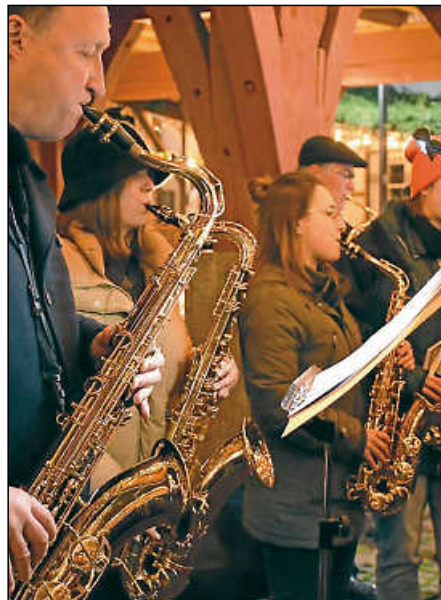
Die Stadtkapelle und weitere Musikgruppen stimmten auf die Weihnachtszeit ein.