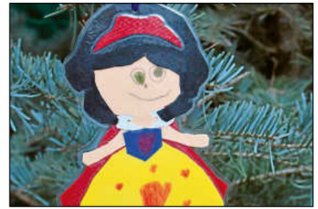
Das Schneewittchen hing am Tannenbaum.