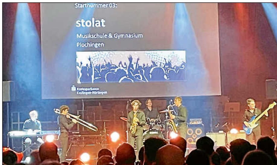
Die Plochinger Band Stolat bei ihrem Auftritt in der Nürtinger Stadthalle, bei dem sie als Sieger des Schulbandcontests von der Bühne ging.

Stolat, die Big Band der Musikschule und des Gymnasiums Plochingen, entwachsen aus der Jazzband der Musikschule Jazztasy – alles Plochinger Talente, Schüler und Abiturienten – riss die rund 800 Musikbegeisterten mit professionellen Improvisationen und Soli mit und setzte sich als Sieger durch. Verbunden mit dem 1. Platz ist ein Preisgeld im Gesamtwert