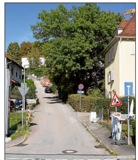
Der Mühlgärtenweg steht vor der Erneuerung.

Die geschätzten Kosten für den Eigenbetrieb Abwasserbeseitigung belaufen sich auf rund 140 000 Euro. Die Unternehmensgruppe Pflugfelder, die den Mittleren Haldenweg erschloss, leistete hierfür bereits einen Kostenbeitrag in Höhe von 25 000 Euro. Für die Erneuerung der vorhandenen Wasserleitung rechnen die Stadtwerke mit Kosten von etwa 110 000 Euro. Im Zuge der Bauarbeiten wird die Stadt Plochingen auch die Asphaltflächen erneuern. Ferner sollen beschädigte Lichtmasten und die Entwässerungsrinne erneuert werden. Die dafür anfallenden Kosten werden auf etwa 125 000 Euro geschätzt. Zudem wird die Netze BW im südlichen Mühlgärtenweg ihre Gasleitungen erneuern, und die Telekom beabsichtigt, Glasfaserleitungen zu verlegen und einen Netzverteiler zu errichten.