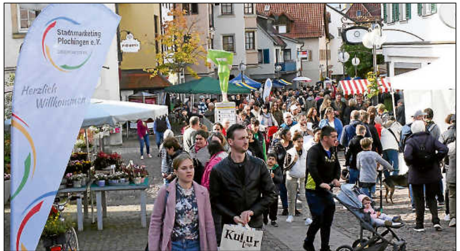
Wie in den Vorjahren werden auch am Sonntag wieder viele Gäste in der Innenstadt erwartet.

Außerdem wird es eine kulinarische Vielfalt an süßen und salzigen Speisen sowie verschiedenen Getränken geben.