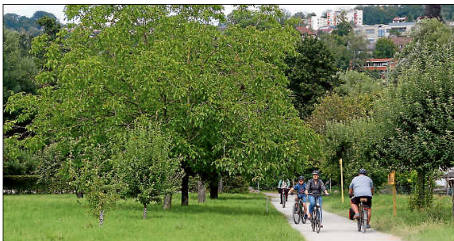
Der Gemeinderat war sich einig: Der Bruckenwasen darf nicht durch den Radschnellweg durchschnitten werden. Eine Alternative könnte entlang der B 10 nach Reichenbach führen.

Einstimmig verabschiedete der Gemeinderat hierzu nun eine Stellungnahme gegenüber dem RP. Die Stadt Plochingen unterstütze die Verkehrswende und sei weiterhin bereit, an der Schaffung des RSW mitzuwirken.