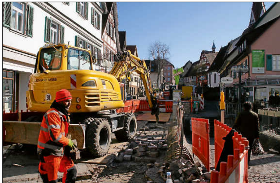
Die Stadtverwaltung teilt mit, dass während der Bauarbeiten mit starker Lärmbelastung gerechnet werden muss. Behelfsbrücken zu den Zugängen werden zeitweise nötig sein.

Noch im Verlauf dieser Woche sollen die Tiefbauarbeiten starten, wofür ein etwa vier Meter breiter und 1,20 Meter tiefer Graben ausgehoben werden muss. In drei Abschnitten zu je 50 Metern soll vorgegangen werden – wobei je Abschnitt eine Woche veranschlagt wird. Außerdem werde vermutlich eine weitere Woche für die Hausanschlussarbeiten benötigt. Aller Voraussicht nach sollen die Kabel Ende März im Boden liegen und die Bauarbeiten beendet sein.