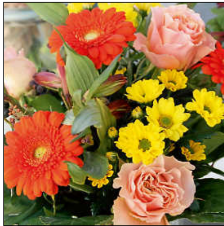
Blumen gegen die Pandemie – Blumenläden haben seit Montag wieder geöffnet.

Während der Betrieb an Kitas, Grundschulen und in Prüfungsvorbereitungsklassen seit eineinhalb Wochen