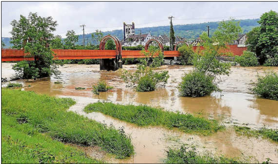
Land unter im Neckarvorland am Bruckenwasen.

Hochwassersituation war auch in Plochingen angespannt – „Glück gehabt“