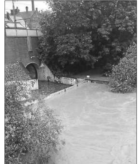
Hochwasserschutz an der Neckartreppe.

Am Freitagabend haben wir im Rahmen unseres Übungsabends die Spundwände an der Neckartreppe gesetzt, da für den Neckar Hochwasser vorhergesagt wurde. Im Laufe des Samstagmorgens erreichte der Neckar die kritische Marke von 5 Metern.