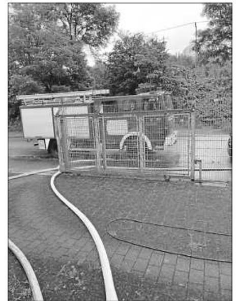
TLF 16/25 beim Keller auspumpen.

Im Bereich Filz wurden wir zu mehreren Einsätzen mit dem Einsatzstichwort Wasser im Keller gerufen. Durch den Dauerregen drückte das Wasser ständig nach und unsere Pumpen waren im Dauereinsatz. Um den Einsatz, der sich bis Sonntag hinzog, bewältigen zu können, arbeiteten wir im Schichtbetrieb. Erst am Sonntagnachmittag konnten wir die Einsatzstellen