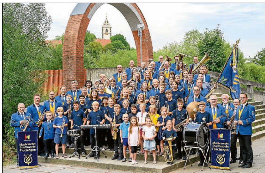
Die Stadtkapelle Plochingen feiert am Samstag und Sonntag ihr 100-jähriges Jubiläum.