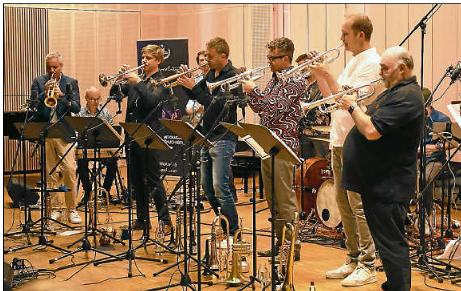
„B&S Trumpet Power“ bei ihrem Auftritt im großen Saal des Musikzentrums in Plochingen.