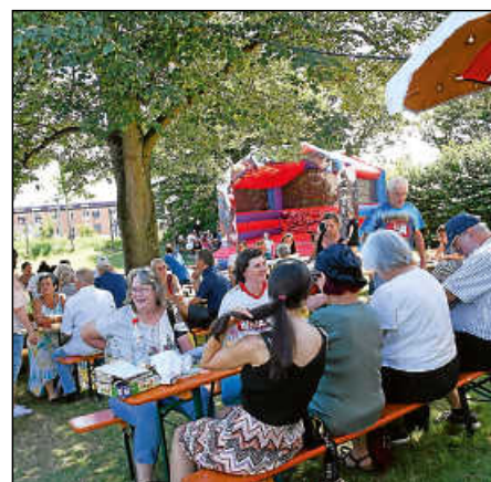
Im Schatten der Zelte und des Jubiläumsturms des Albvereins ließ es sich aushalten.

rund 320 Grad im Holzbackofen unter Verwendung von Nadelholz. 20 bis 25 Brote passen hinein. Mehrere Fuhren hat Berger täglich gebacken und die leckeren Brote waren schnell verkauft. Dafür standen die Leute auch Schlange. „Letztes Jahr habe ich das Brot verpasst, heute gebe ich mir mehr Mühe“, meinte eine Besucherin in der Warteschlange.