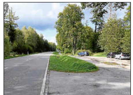
Die Holzablagestelle zwischen Jahnstadion und Weißer Stein soll für Pkws geschlossen werden.