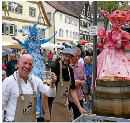
Auch dieses Jahr wird es wieder Freibier geben und auch die Stelzenläufer werden wieder unterwegs sein.

Beim bunten Kinderprogramm können die kleinen Gäste mit dem Karussell fahren, mit einer Obstpresse selbst Apfel-