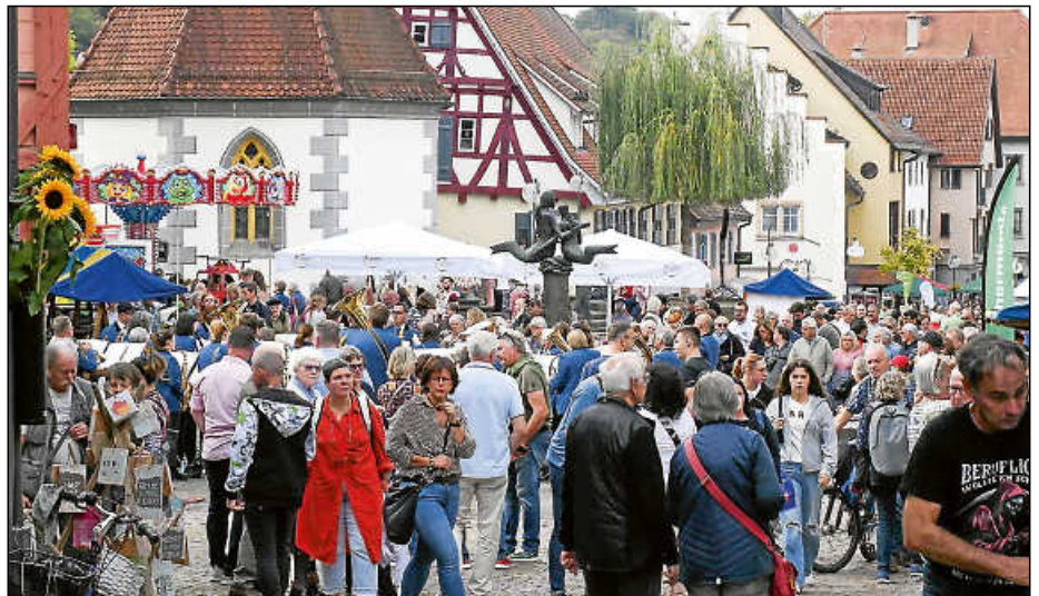
Viele Besucherinnen und Besucher wird es wieder auf den Marktplatz und in die Marktstraße ziehen.

saft herstellen oder den Freunden der Schmiedekunst bei ihren Schauschmiedevorfürungen zusehen.