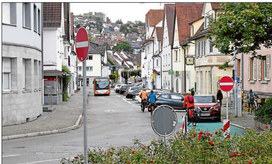
Die Bahnhofstraße soll nach der Neuordnung vor allem für Fußgänger und Radfahrer attraktiver werden. Es soll beidseitig längs geparkt werden und einen Radweg in beide Richtungen geben.

Für die CDU sei dies eine erfreuliche Nachricht, sagte Reiner Nußbaum (CDU). Der Bereich benötige dringend einen „neuen Anstrich“ und die Bürger würden auf eine Veränderung warten. Das Eingangstor zur Stadt müsse aufgewertet werden und ein anderes Flair bekommen. Die Ausgestaltung sei sinnvoll, um der Bedeutung der Straße gerecht zu werden. Zudem sei die Straße auch eine attraktive Fahrradverbindung. Und die Finanzierungsangaben seien nachvollziehbar.