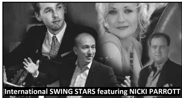
International SWING STARS featuring NICKI PARROTT

„The Great American Song Book & more - von Ella Fitzgerald bis Frank Sinatra“