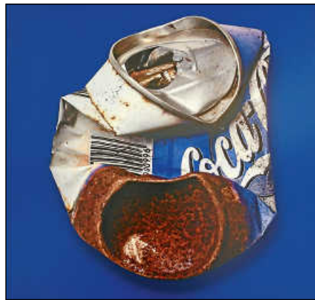
Inszenierte Fundsache: Coca-Cola in/auf Blau.

Keller bearbeitet die Getränkedosen digital, indem er sie beispielsweise durch Überblendungen, Übermalungen und Transparenzeffekte verfremdet. Am