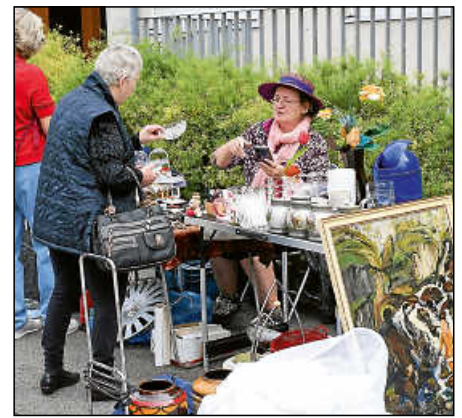
Der große Flohmarkt hat auf dem Plochinger Herbst Tradition. Hier wechselt allerhand Antiquarisches und Kurioses den Besitzer.